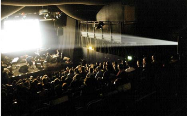
Boxhead Ensemble-ը (Բոքսհեդ Անսամբլ) 2001թ Դուբլինի Կինոփառատոնին: